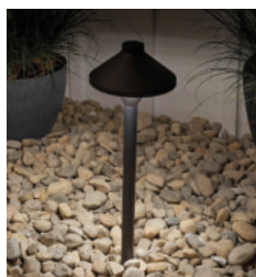
Blanc pur 3000 K