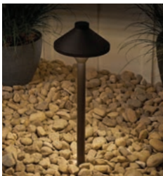
With warming dome (comparable to 2700K)