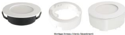
Montage Anneau (vendu séparément)