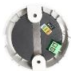
Interrupteur à glissière durable réglable CCT, peut être réglé sur 3000K, 4000K ou 5000K